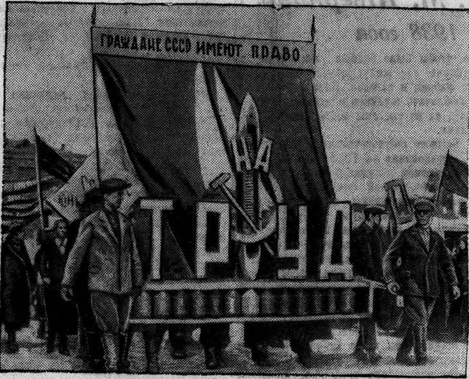
В честь 24 Международного Юношеского Дня в городе Барнауле состоялась массовая демонстрация трудящихся. НА СНИМКЕ: колонна молодежи Барнаульского меланжевого комбината проходит по площади Свободы.