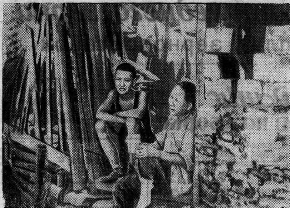
НА СНИМКЕ: китайка со своим раненым сыном на пороге дома, разрушенного бомбами японских агрессоров (гор. Учан).

ХАНЬКОУ, 3 сентября. (ТАСС). На Баодина сообщают, что 500 китайских солдат охранявших войск Вейли-Ханькоуской железной дороги встали против японцев и перешли на сторону партизан около Маньчжэна (севернее Баодина). Вся местная полиция и некоторые чиновники китайских учреждений Маньчжэна также перешли на сторону партизан.