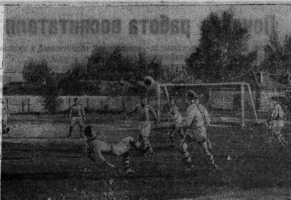
6 августа, на стадионе «Динамо» состоялась встреча футбольных команд «Динамо» Баку с динамовцами Барнаула. Результат игры 7:1 в пользу бакинцев. НА СНИМКЕ: один из моментов игры.

выступала против Чехословакии, как она это делает сейчас. Пражский корреспондент этой же газеты пишет, что вся эта «комедия» с летчиками инспирирована Берлином сознательно и умышленно, в связи с пребыванием в Праге Ренсимена.