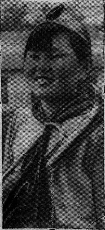
Одротня. Понерка Фото-монтаж МЯСНИКОВА.

После спада воды на реке Хуанхэ, китайские передовые части начали продвижение по направлению к Байфину (главный город провинции Хэнань) и выходят в 8 километрах от города.