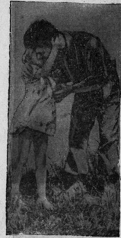
НА СНИМКЕ: Девочка-испанка желает успеха своему отцу, уходящему на фронт для борьбы с фашистскими варварами.