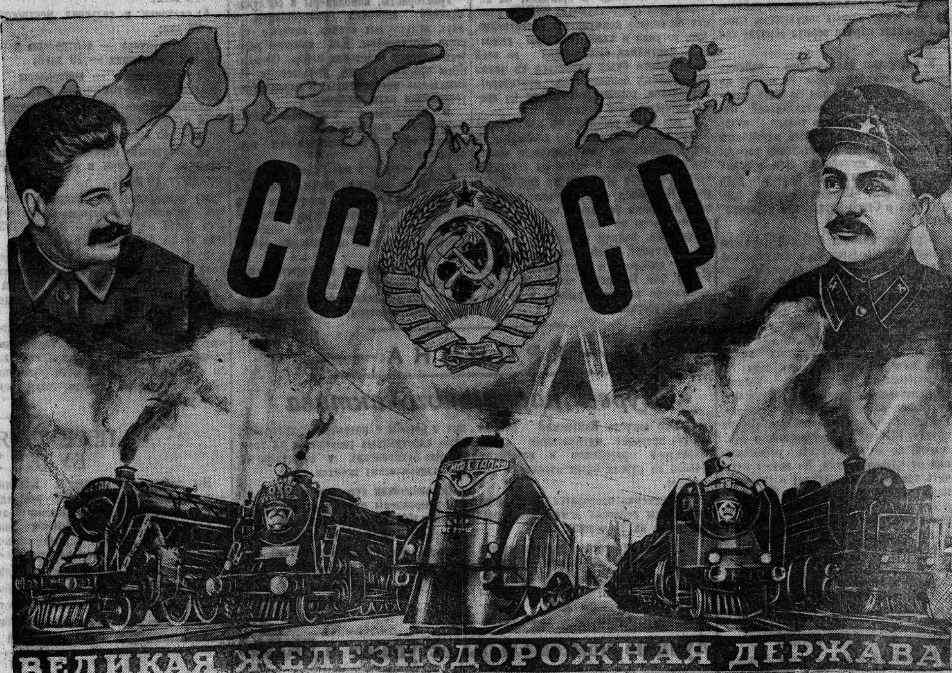
Фото-монтаж И. Харина.

В исторический день — день всенародного праздника железнодорожников — привет лучшим людям великой железнодорожной державы!