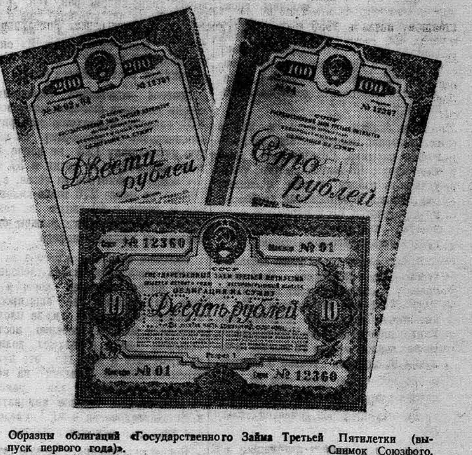
Образцы облигаций Государственного Займа Третьей Пятилетки (выпуск первого года).

национальной культуры, о счастье жить и работать в эпоху сталинских пятилеток. С какой любовью агитаторы рассказывали избирателям о великом Сталине, его соратниках, о кандидатах блока коммунистов и беспартийных.