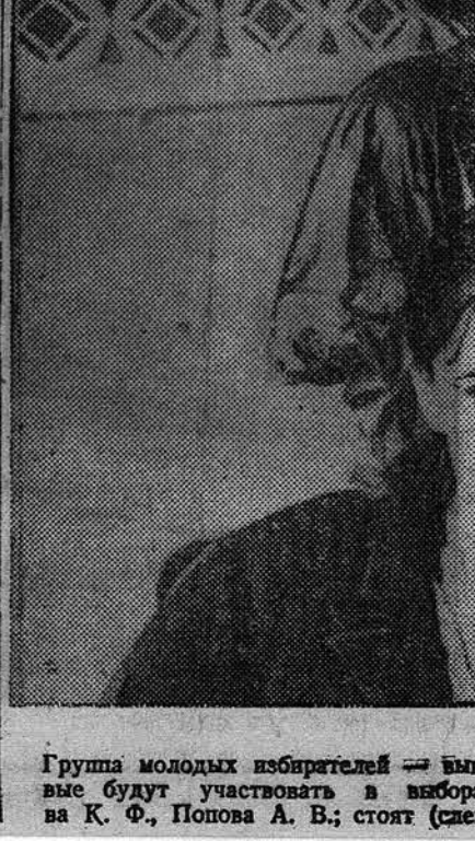
Собрание молодых избирателей Барнаульского педагогического училища — 26 июня 1938 года впервые будут участвовать в выборах Верховного Совета РСФСР.