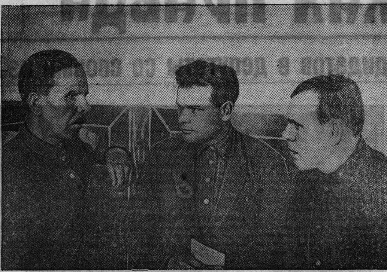
20 июня Барнаульский сельский райком ВКП(б) провел собрание партийного актива района по итогам первой Алтайской краевой партийной конференции.

Чтобы правильно решить вопрос о сорторайонировании, необходимо глубоко продумать этот вопрос и учесть весь опыт, накопленный стахановцами социалистического земледелия.