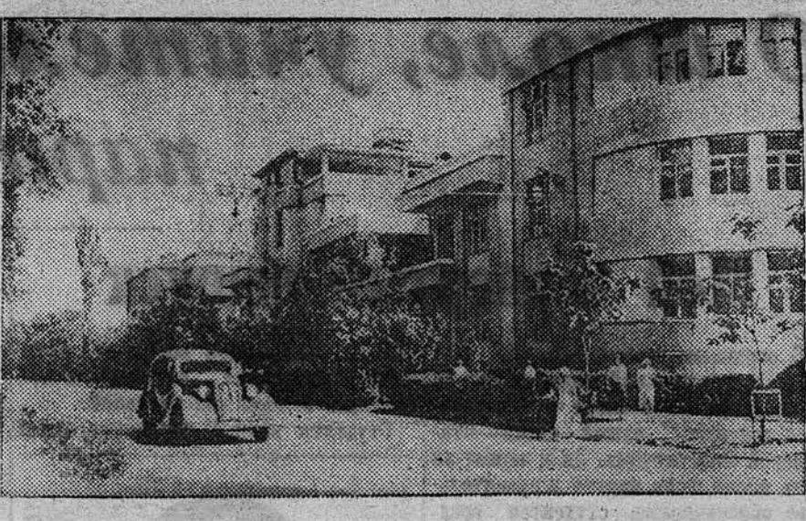
По городам Советского Союза. На снимке: улица Карла Маркса в г. Ташкенте. Справа — здание парткурсов при ЦК КП(б) Узбекистана.

План погрузки выполнен на 80,5 процента. План выгрузки выполнен на 84,2 процента.