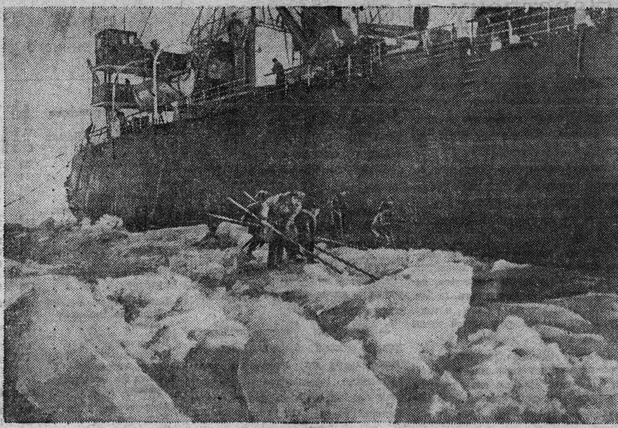
НА СНИМКЕ: Ледокол «Брэм» во льдах Финского залива. Команда ледокола откалывает лед.