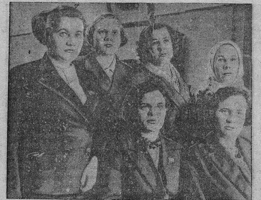
В феврале в Кремле состоялось совещание женщин-членов ВЦИК. На совещании выступил Председатель Президиума Верховного Совета СССР тов. М. И. Калинин.