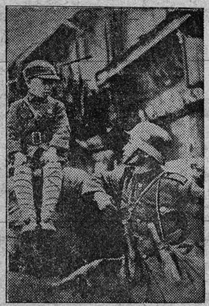
«МЫ ЕЩЕ ВЕРНЕМСЯ». На снимке: Китайский солдат — защитник Наньтоу (Шанхай) от японских интервентов беседует с китайским мальчиком перед отступлением из города.

В самом начале избирательной кампании национал-царанисты добились некоторого частичного успеха, выразившегося в том, что центральная избирательная комиссия вынуждена была признать недействительными действия министерства внутренних дел при подготовке к избирательной кампании и предоставить национал-царанистам третье место в избирательном бюллетене, а «железнодорожникам» — пятое место.