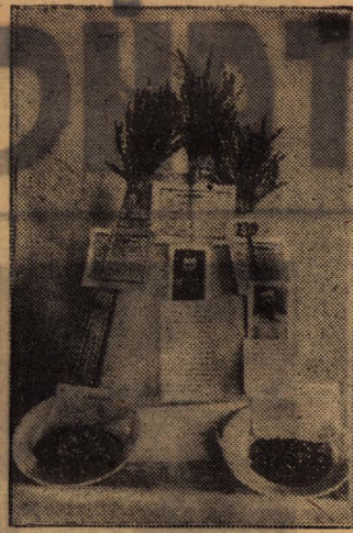
Колхозы «Вперед к коммунизму» и «1-е августа», Карасуевского района, проводят в этом году внутрисортовое скрещивание пшеницы. На снимке: всходы колосьев пшеницы, приготовленные на Всероссийскую сельскохозяйственную выставку. Экспонат вырощен колхозниками т. Солодовниковым и Грузиным.