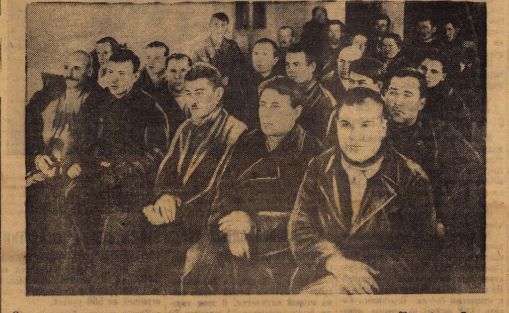
Совещание передовых стахановцев-колхозников по масляничным культурам, состоявшееся 23 декабря в Славгородском районе. На снимке: участники совещания слушают доклад об итогах соревнования звеньев масляничных культур. (Фото Мельникова).