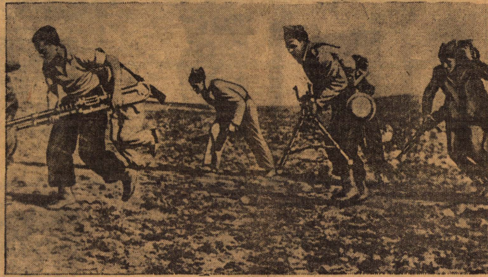
На снимке: группа республиканских пулеметчиков занимает новые позиции, оставшиеся фашистами (центральный фронт).

Партийные организации несут всю полноту ответственности за успешную подготовку к севу, их никто не освобождает от руководства сельским хозяйством, и они обязаны принять все меры к тому, чтобы в ближайшее же время устранить все недостатки и с честью провести первую весну третьей сталинской пятилетки.