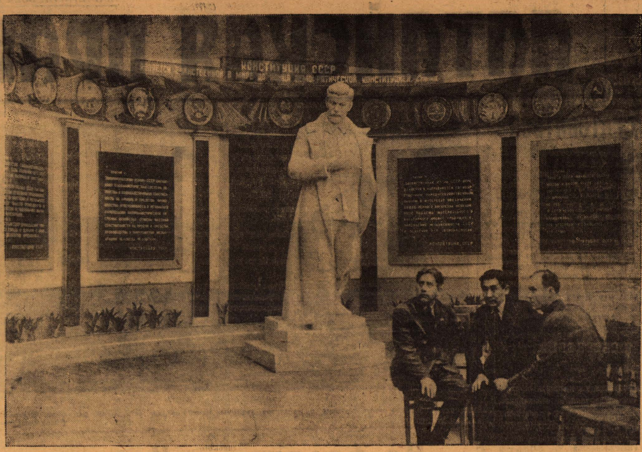
В Москве на Каляевской улице в новом помещении вновь открылся Центральный Антираeligиозный музей. На снимке: один из залов оформлен по теме «Сталинская Конституция и задачи антирелигиозной пропаганды».