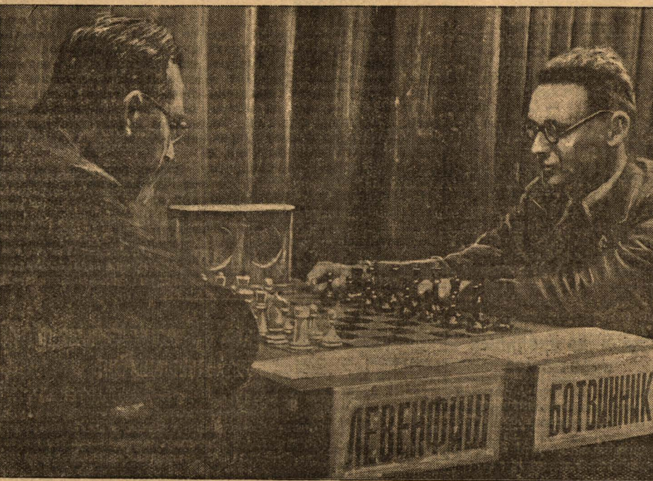
С 5-го октября в Большой аудитории Политехнического музея (Москва) проходит шахматный матч на первенство СССР между М. Ботвинником и Г. Я. Левенфишем. Сыграно 3 партии. Счет матча 1:2 в пользу Левенфиша. На снимке: момент шахматного матча.

КРАСНЫЙ ЛУЧ, 10 октября. (ТАСС). Передовики шахт треста 'Донбассантрацит', вернувшиеся с вседневного слета стахановцев и ударников-шахтеров, показывают новые образцы высокой производительности. На шахте имени 'Известий' участник вседневного слета шахтеров лучший стахановец