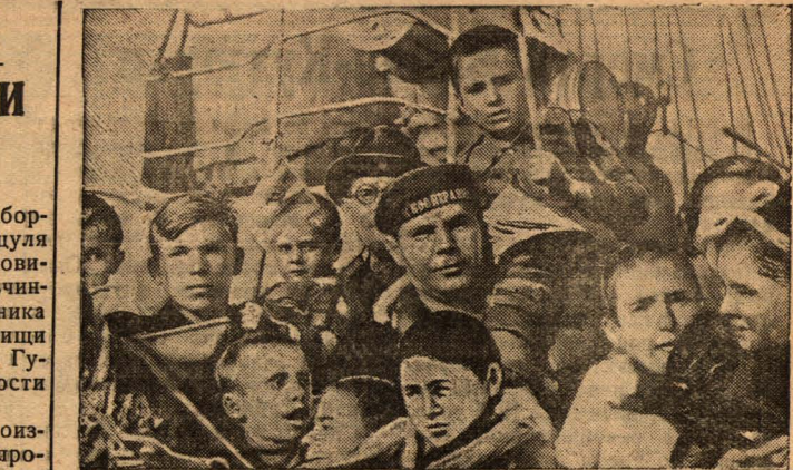
8-го октября в Ленинград на теплоходах «Кооперация» и «Феликс Дзержинский» прибыли дети бойцов республиканской Испании. На снимке: испанские дети на борту теплохода «Кооперация».

Вопрос предвыборной агитации в капиталистических странах есть вопрос денег, и поэтому буржуазия не жалеет средств для достижения своих целей. Каждая буржуазная партия имеет в своем распоряжении крупные суммы, поступающие от отдельных престов, банков, предпринимателей, от участия в различных делах и т. д. и т. п. Эти деньги идут на покупку голосов, газет, на подкуп избирателей, выборы чиновников и депутатов. По официальным данным, избирательная агитация в США на выборах 1936 года стоила буржуазным партиям 13 миллионов долларов. Помимо этих сумм миллионы долларов были израсходованы на цели, о которых буржуазия предпочитает не говорить открыто. Агенты буржуазных партий платят избирателям не только за голоса, поданные в пользу этих партий, но так же щедро оплачивают сторонников других буржуазных партий, чтобы они воздержались от подачи голосов за своих кандидатов. Тем самым уменьшается количество голосов, пода-