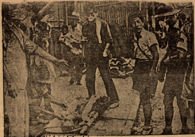
Санитары убирают изуродованные трупы жертв варварской японской бомбардировки.