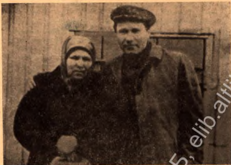
В. М. Шукшин с матерью.

По просьбе Бийской студии телевидения принял участие в создании документального фильма о городе Бийске.