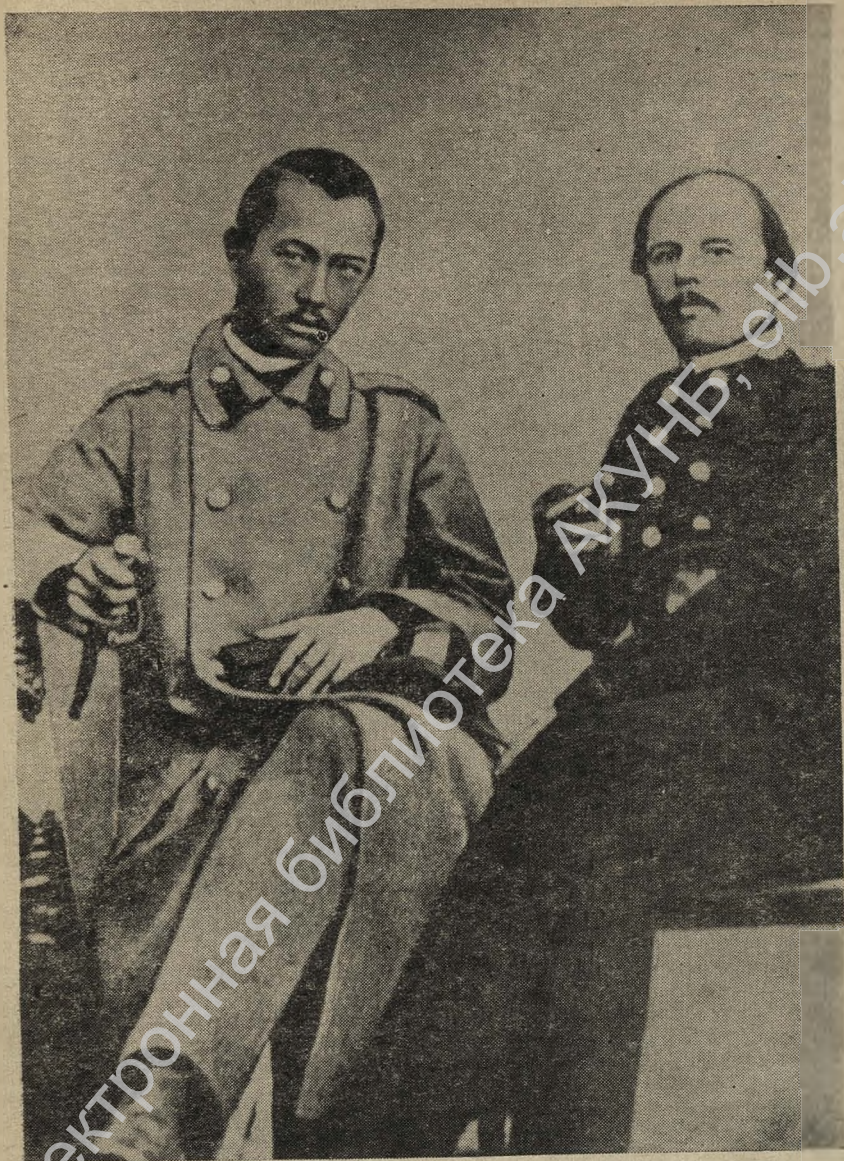
Ф. М. Достоевский и Чокан Валиханов в Семипалатинске.