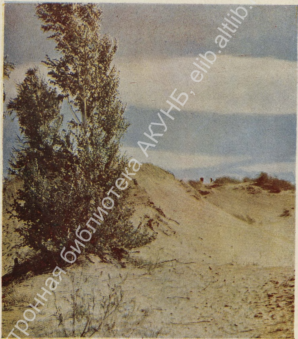
Песчаная горка вблизи Шушенского — любимое место прогулок Владимира Ильича.