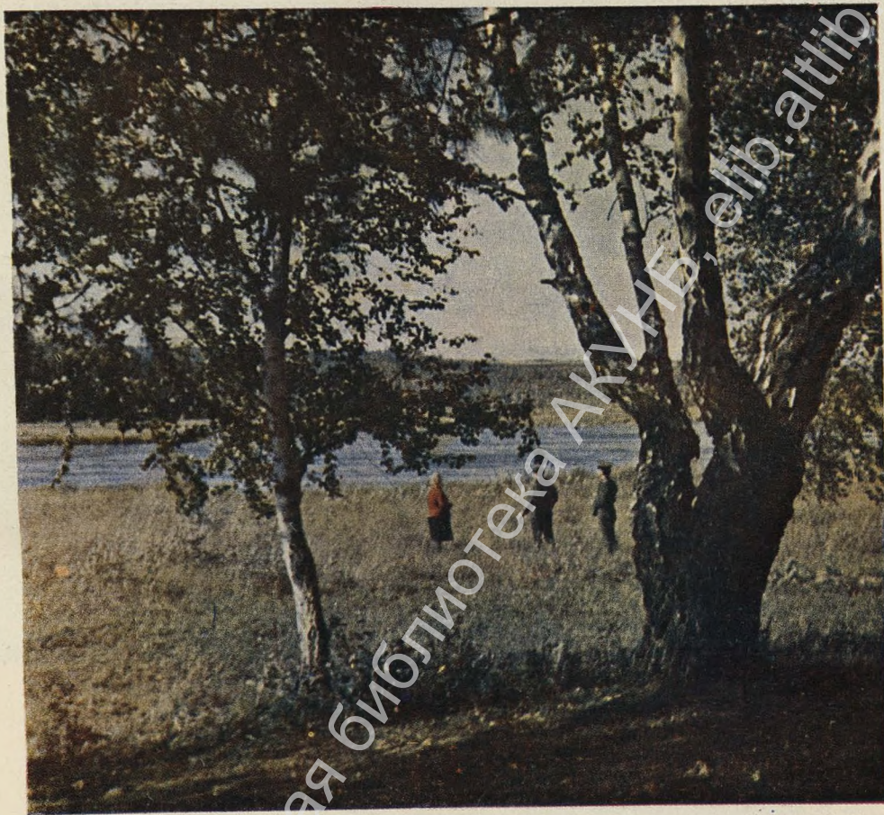
Живописные берега реки Шуши. Здесь В. И. Ленин вместе с Н. К. Крупской проводил свободные часы после напряженных трудов.