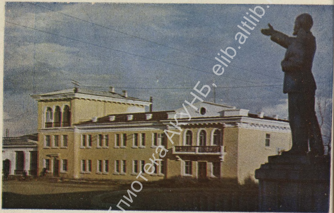
Памятник В. И. Ленину в Шушенском на площади, носящей имя великого вождя.