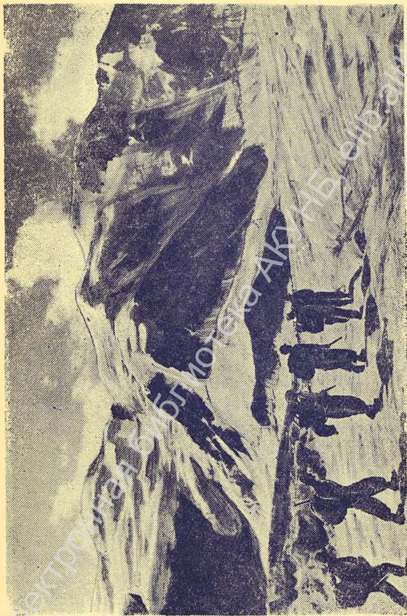
На леднике Мен-су.