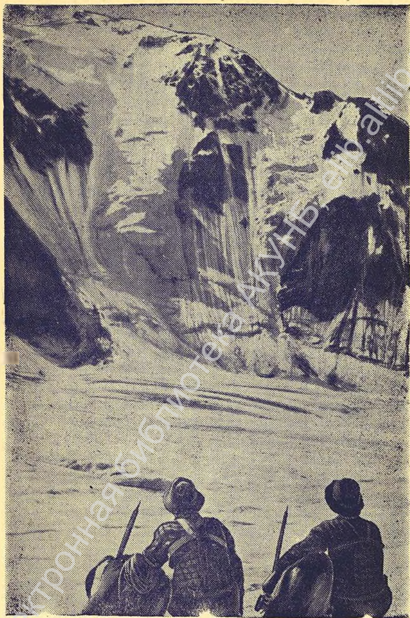
У подножья пика «Героической Кореи».