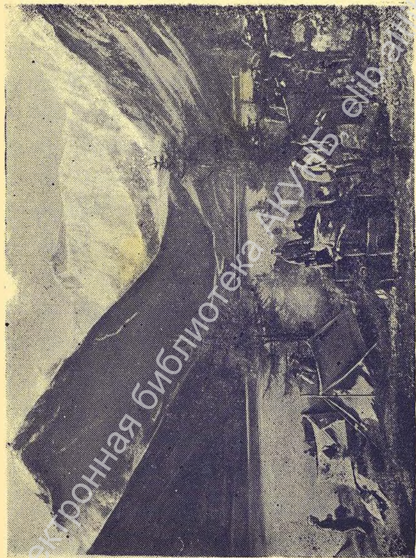
Северная стена Белухи и Аккемское озеро. На переднем плане лагерь экспедиции.