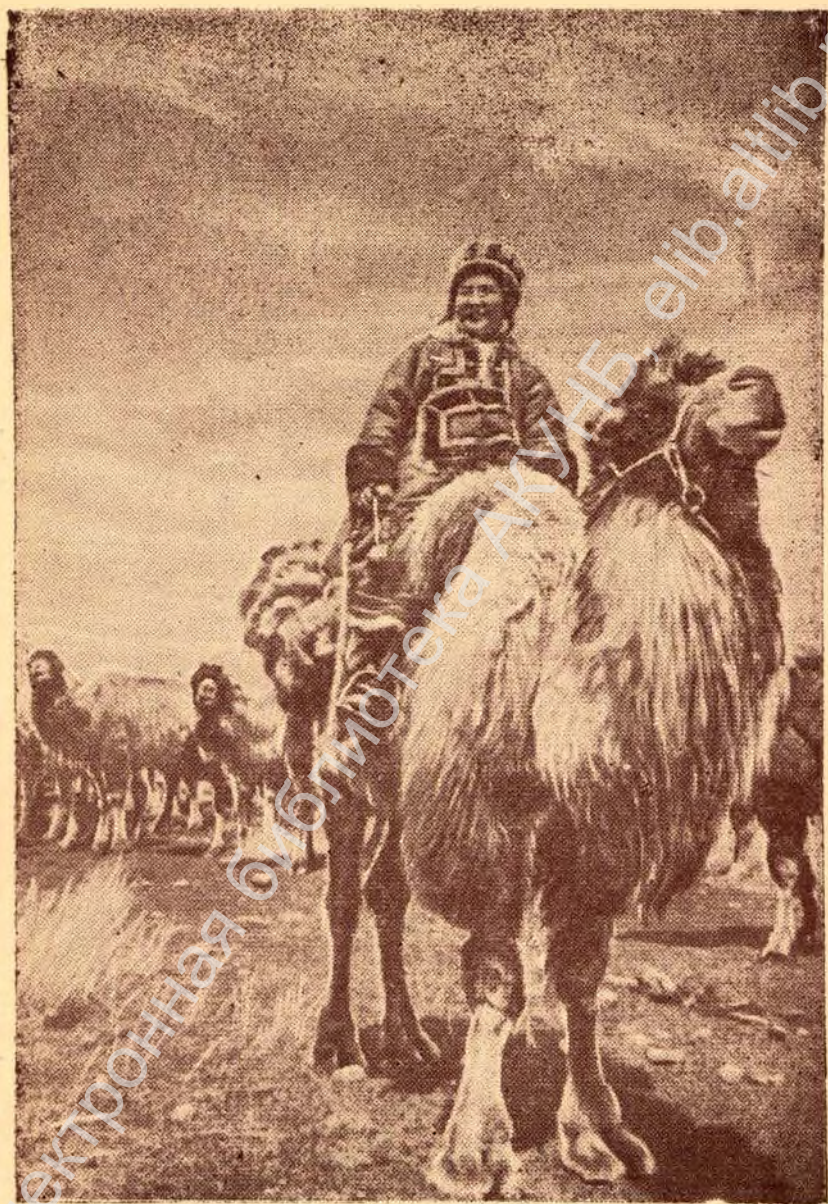
В Горном Алтае. Верблюды на пастбище.