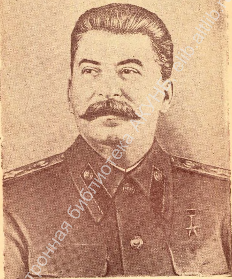
Иосиф Виссарионович Сталин.