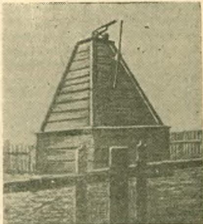
Памятник в с. Чистюнька на братской могиле павших в бою повстанцев

Что особенно интересовало повстанцев, так это урожай, который должен был обеспечить продовольствием весь район восстания. И в первую очередь надо было обеспечить уборку полей повстанцев, находящихся в боевых рядах или павших в боях. Этому главный штаб добился. Уборка этих полей поручена была восстановленным «Сельским советам крестьянских и рабочих депутатов». Советы были восстановлены во всех деревнях и селах отвоёванной территории. Эти советы фактически руководили всей гражданской и хозяйственной жизнью сел и деревень. Они