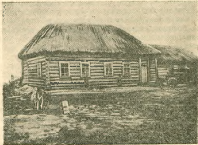
Дом партизана Жогова в п. Собацьи хутора, в котором в 1919 году скрывались подпольщики перед восстанием