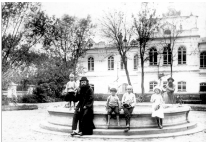
У фонтана в Архиерейской роище Бийского архиерейского дома. Фото начала XX в.