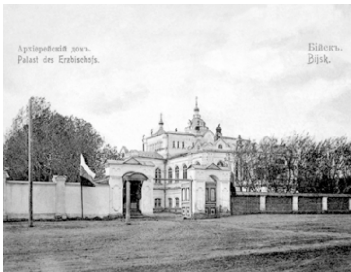
Бийск. Архиерейский дом. Здесь с 1888 по 1891 г. жил епископ Бийский Макарий (Невский). Фото начала XX в. Из фондов музея истории Алтайской духовной миссии

Архиерейский трехэтажный дом был венцом трудов епископа Владимира в Бийске и в нижнем его этаже размещались помещения для братии, певчих, иконописцев, библиотека, склад; второй этаж служил для богослужебных беседований, там находились комнаты епископа – начальника миссии, на третьем этаже находилась церковь на шестьсот человек с особой колокольней. При доме имелись все необходимые службы.