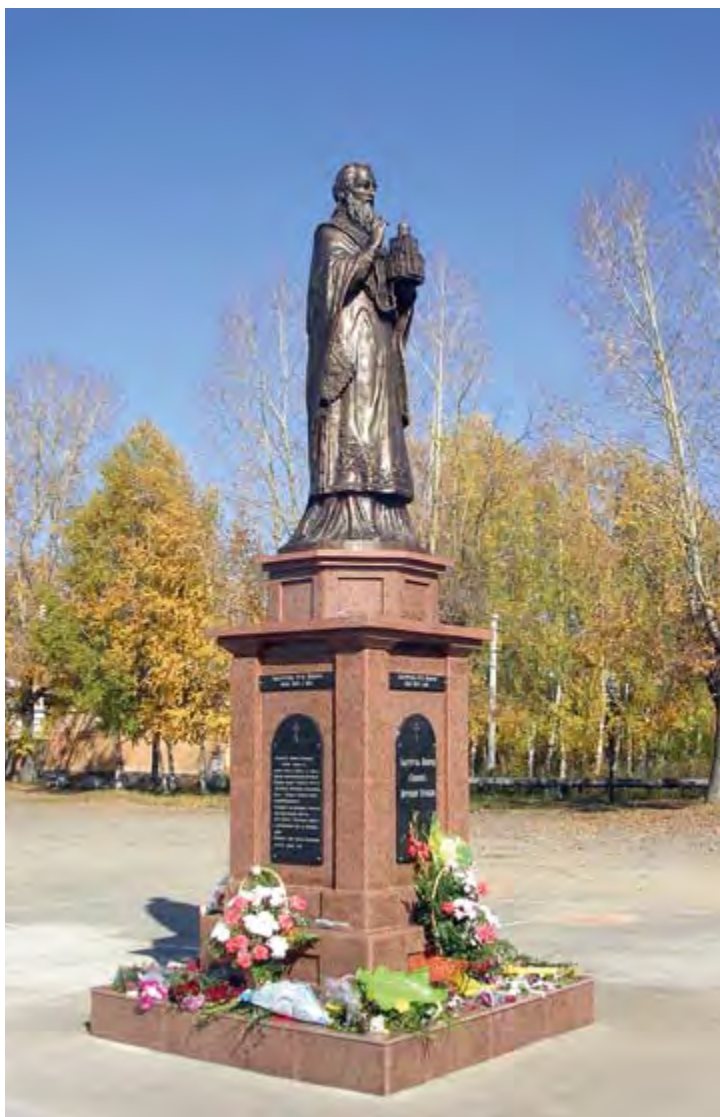
Памятник святителю Макарию (Невскому), митрополиту Алтайскому на Архиерейской площади Бийского архиерейского подворья. Скульптор – С.М. Исаков. Открыт 1 октября 2009 г.