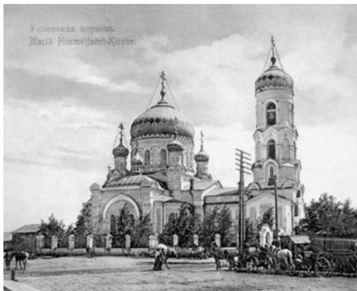
Градо-Бийская Успенская церковь. 1910-е гг.

22 июня 1914 г. вся набережная Бийска была запряжена народом, встречавшим митрополита Макария. По широкой, покойной реке, словно шелк стелившейся по этой благодатной и райской земле, тихо скользил большой трехпалубный пароход.