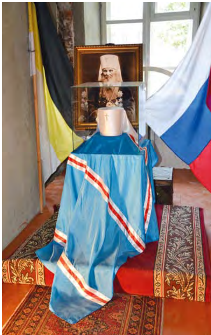
Фрагмент экспозиции «Белый клобук Алтая», посвященной святителю Макарию (Невскому) в музее истории Алтайской духовной миссии г. Бийска. Фото П. Коваленко. 2012 г.