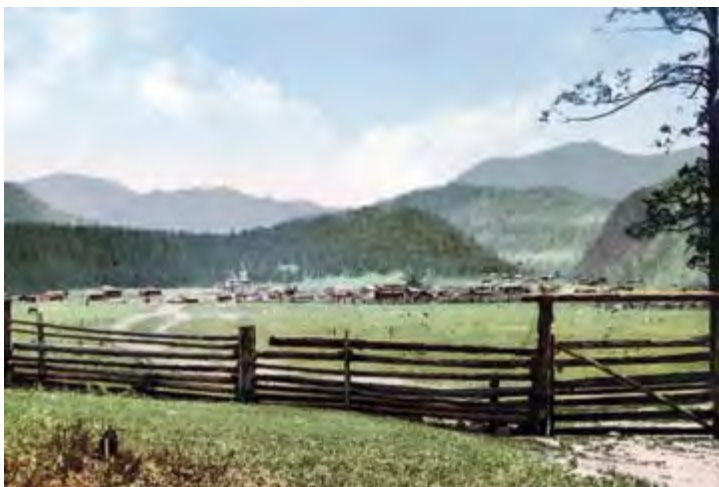
Село Чемал – место служения иеромонаха Макария (Невского). Почтовая открытка нач. XX в.