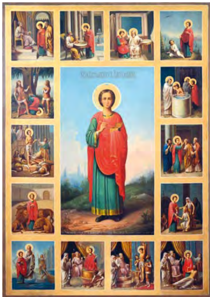
Икона святого великомученика и целителя Пантелеимона Афонского письма. Находится в Казанской церкви г. Бийска. 1893 г.