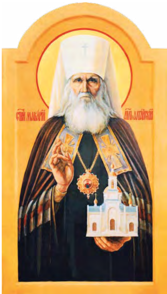
Мироточивая икона святителя Макария (Невского) – главная святыня Покровского храма г. Бийска