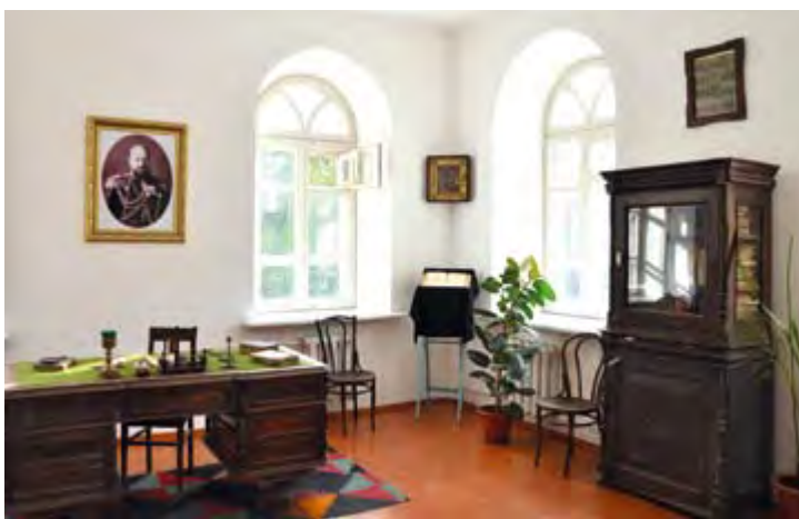
Фрагмент мемориальной экспозиции «Кабинет Бийских архиереев» в музее истории Алтайской духовной миссии. 2014 г.