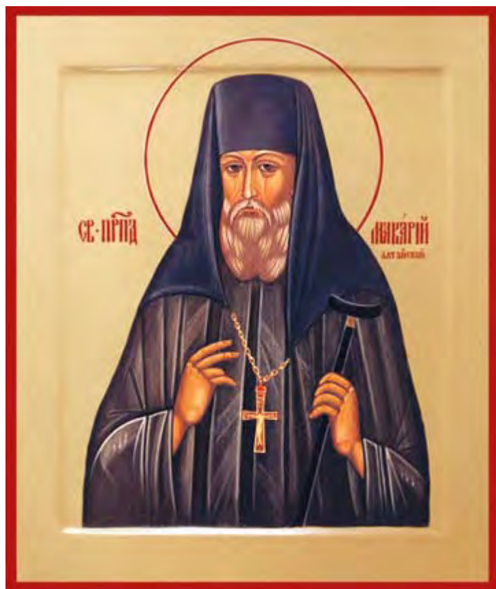
Икона преподобного Макария (Глухарева) Алтайского – основателя Алтайской духовной миссии