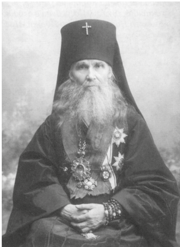
Высокопреосвященнейший Макарий (Невский), архиепископ Томский и Алтайский. Фото периода 1908–1912 гг.

по погромной деятельности архиерея. Той же заранее выработанной установки держалась и вся оппозиционная пресса. Макарий, следуя совету Победоносцева, два года молчал, и когда «лай затих», а