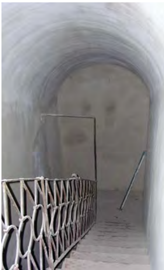
Потайная лестница в стене Бийского архиерейского дома. 2006 г.