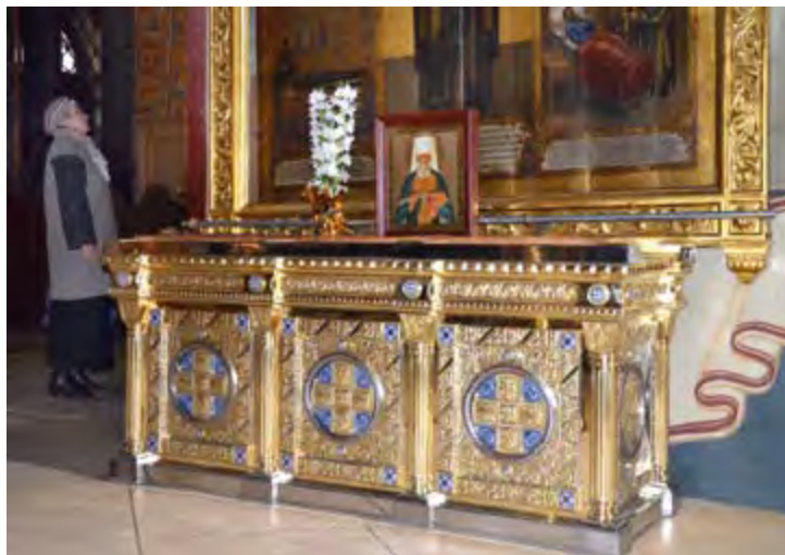
Рака с мощами святителя Макария (Невского) постоянно пребывает в Успенском соборе Троице-Сергиевой лавры. Фото П. Коваленко. 2015 г.