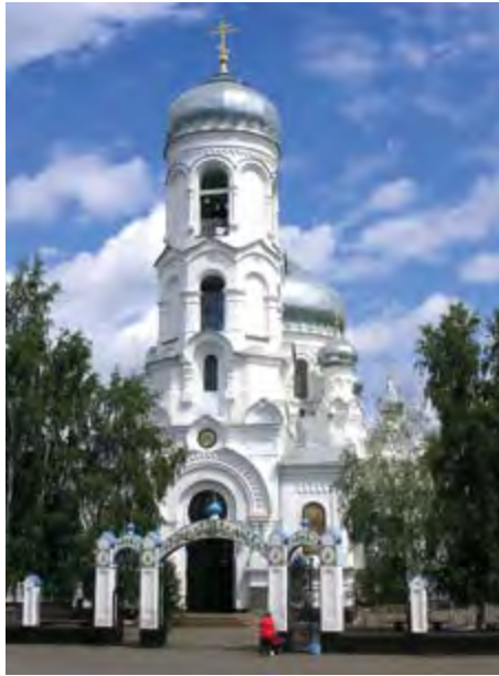
Успенский кафедральный собор. Здесь неоднократно служил святитель Макарий (Невский). 2006 г.