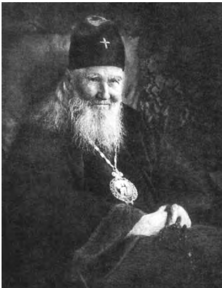
Высокопреосвященнейший Макарий (Невский) в последние годы жизни

даже на заседания миссионерского отдела. Он обратился к Собору с просьбой хотя бы разобраться в его деле и расследовать справедливость тех обвинений, по которым он был отстранен от управления Московской епархией, считая это необходимым не столько лично для себя, сколько для чести всей