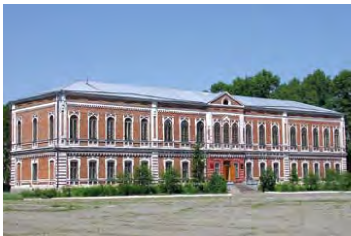
Здание бывшего Бийского миссионерского катехизаторского училища. Фото П. Коваленко. 2005 г.