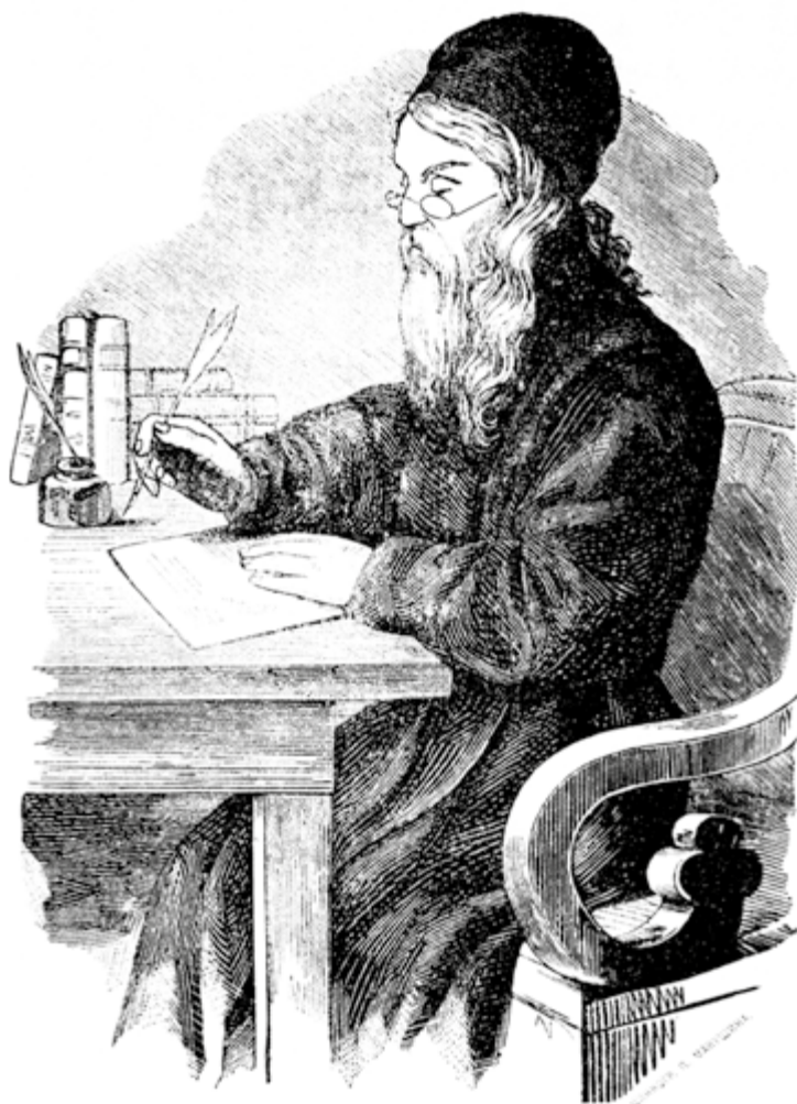
Первоапостол Алтая – преподобный Макарий (Глухарев). Литография из журнала «Томские епархиальные ведомости», нач. XX в.