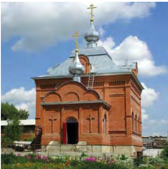
Свято-Макарьевский крестильный храм на территории Бийского архиерейского подворья. 2013 г.