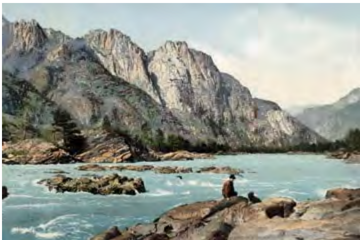
Порог на реке Катунь выше села Чемал. Почтовая открытка нач. XX в.