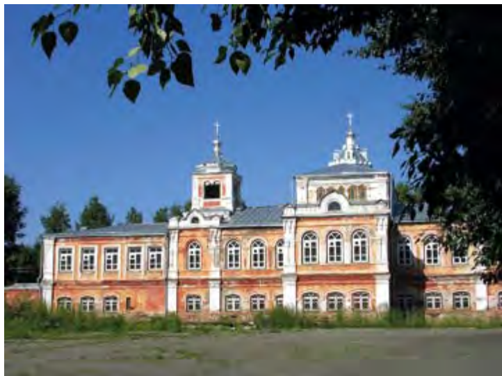
Бийск. Архиерейский дом. С 2009 г. в здании – музей истории Алтайской духовной миссии. 2005 г.