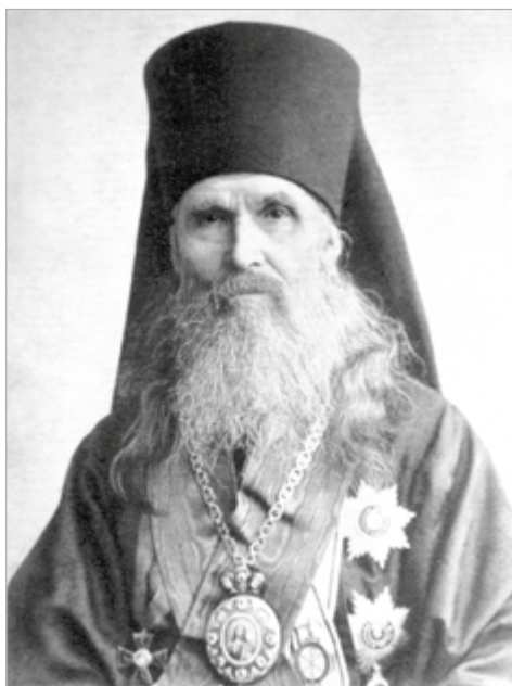
Преоcвященнейший Макарий (Невский), епископ Томский и Барнаульский

К этому времени Томск уже охвачен студенческими волнениями, о которых Победоносцев пишет: «Болезнь охватила всю Россию и не была бы она так повальна, когда бы ни поддерживалась еще безумием взрослых людей, составляющих у нас общество. Горячка не успокаивается и до сих пор, – и вот, к сожалению, нет еще властной той руки с властным голосом, который изрек бы: «До сего дойдешь и не преjdeши». Слава Богу, что семинария еще не задета. Были уже