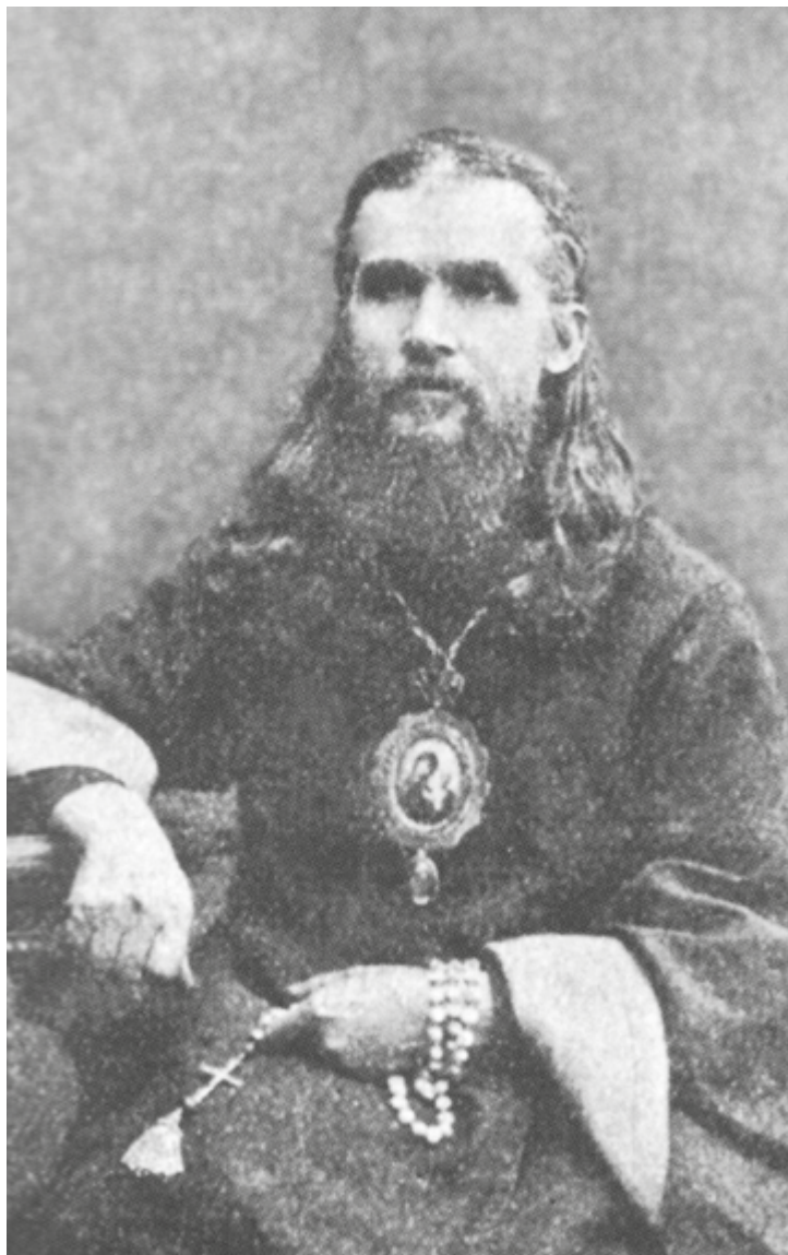
Преосвященнейший Макарий (Невский), епископ Бийский, начальник Алтайской духовной миссии. Фото периода 1884–1891 гг.