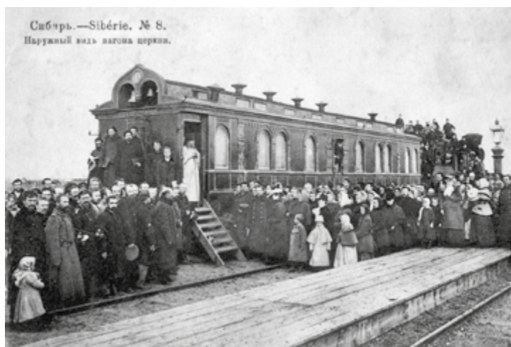
Наружный вид вагона-церкви. На ступенях вагона – святитель Макарий (Невский). Открытка нач. XX в. Из фондов музея истории Алтайской духовной миссии

В ноябре 1912 г. священномученик митрополит Владимир (Богоявленский) был переведен с Московской кафедры на Санкт-Петербургскую. Обер-прокурор Святейшего Синода В.К. Саблер предложил кандидатуру архиепископа Антония (Храповицкого). Сначала Государь согласился, но через несколько дней переменял решение. 25 ноября 1912 г. вышел «Высочайший рескрипт о назначении Архиепископа Томского на Московскую Митрополию». В нем Государь Николай Александрович от лица всего православного народа подводил итог многодесятилетних безукоризненных трудов отца Макария на благо церкви. В конце документа выражалась твердая надежда, что и «на новом поприще Макарий явит себя ревностным и самоотверженным блюстителем интересов и величия Святой Православной Церкви».