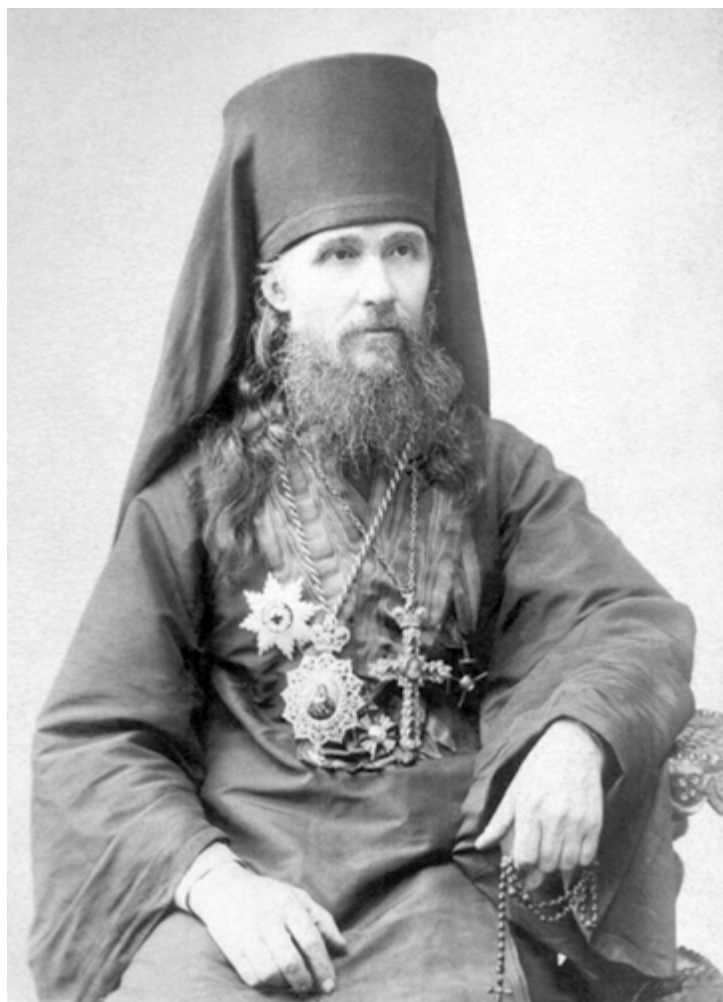
Епископ Бийский Макарий (Невский)

манского Благовещенского монастыря во время ремонтных работ в Болховском Оптином монастыре были обретыены нетленные мощи архимандрита Макария (Глухарева), к которым началось паломничество со всей Орловской губернии.