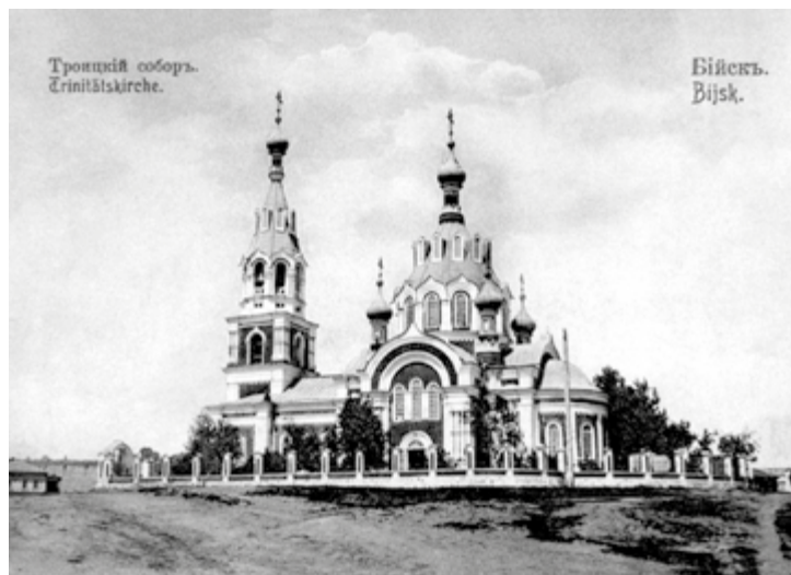
Бийск. Троицкий собор. Здесь многократно совершал богослужения святитель Макарий (Невский). Фото начала XX в.

Закладка и строительство в Бийске Архиерейского подворья епископом Владимиром совпала по времени с закладкой в Томске первого высшего учебного заведения Сибири, в год открытия которого епископ Макарий в Бийске освятил только что восстановленный после пожара 1886 г. архиерейский дом!