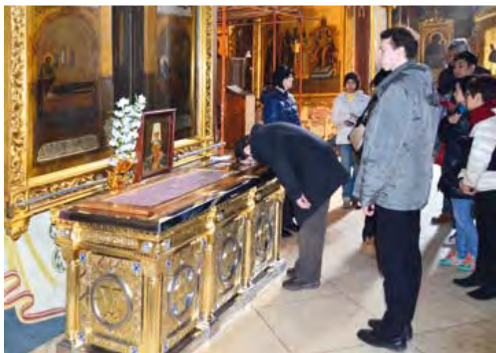
Ураки с мощами святителя Макария (Невского) всегда многолюдно. 2015 г.