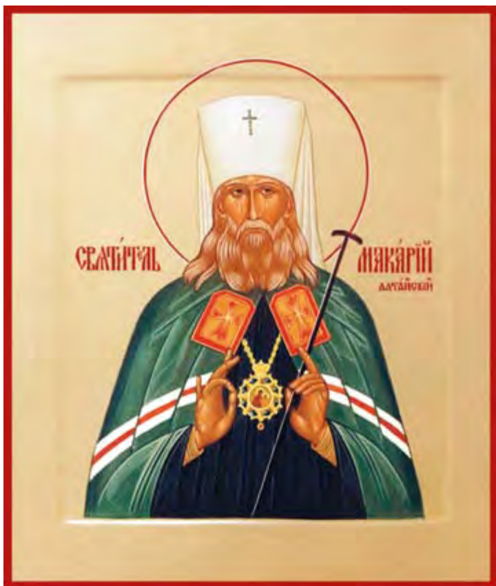
Икона святителя Макария (Невского), митрополита Алтайского