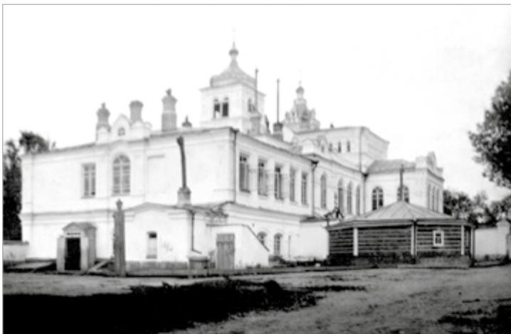
Бийск. Архиперейский дом. Фото 1914 г.

Десятилетие епископства Макария (Невского) совпадает еще с появлением на Алтае человека, известного в России под именем странника Антония.