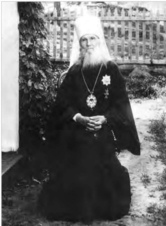
Макарий (Невский), митрополит Московский и Коломенский во время пребывания в с. Чемал, 1914 г.

Приготовившись таким образом к празднику и пережив со Христом его страдания и крестную смерть, маститый архипастырь встречал Светлое