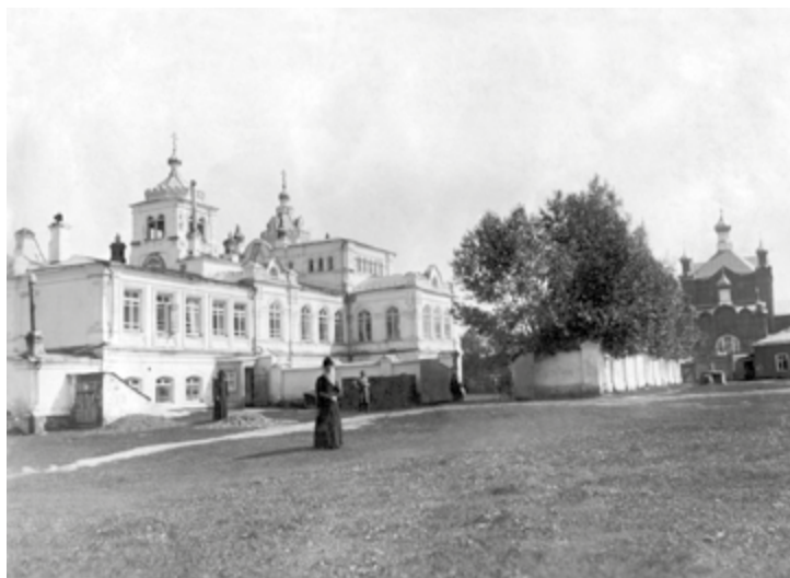
На территории Бийского архиерейского дома.