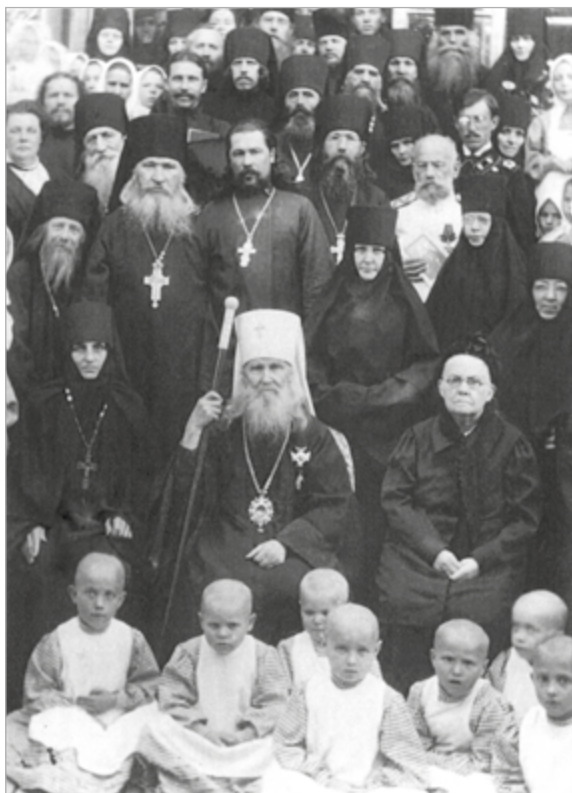
Макарий (Невский), митрополит Московский и Коломенский среди воспитанниц Шамординского приюта. 1912 г.

к древней деревянной церкви Успения Пресвятой Богородицы, слушал богослужения через отворенное окно. Несмотря на строгое воздержание в пище, владыка отдавал много сил службе: сам читал «Великий канон» св. Андрея Критского. «Поклоны», заимствованные из Саровской пустыни, владыка проходил вместе со скитянами. 1 марта он отслужил литургию и молебен Федору Тирону (канон читал сам, а не канонарх). Сослужившие ему говорили, что «при нем как-то не страшится».