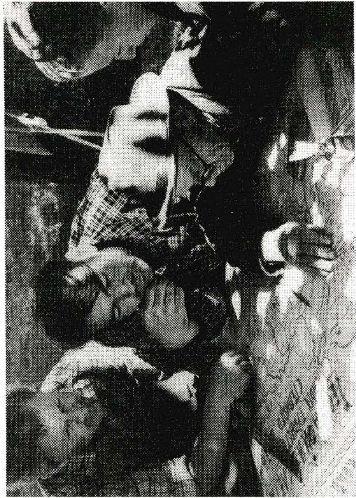
II Краевой слет юных туристов Алтая, 1961 г.