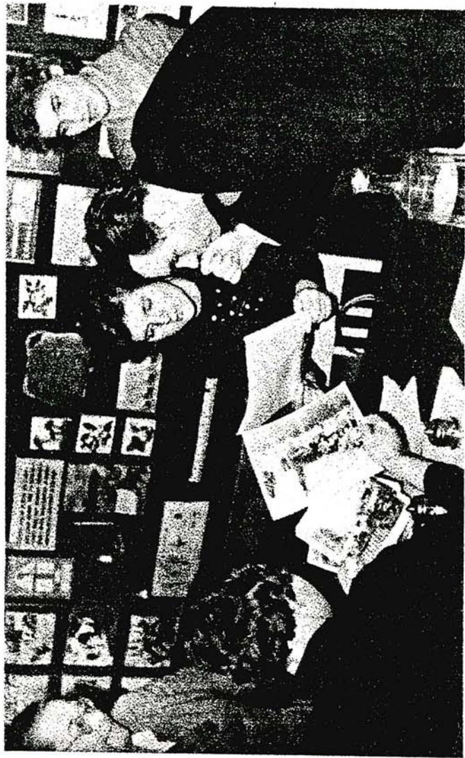
Встреча организаторов детского туризма. Начало 1960-х гг. Архив Краевой станции юных туристов (КСЮТУР).