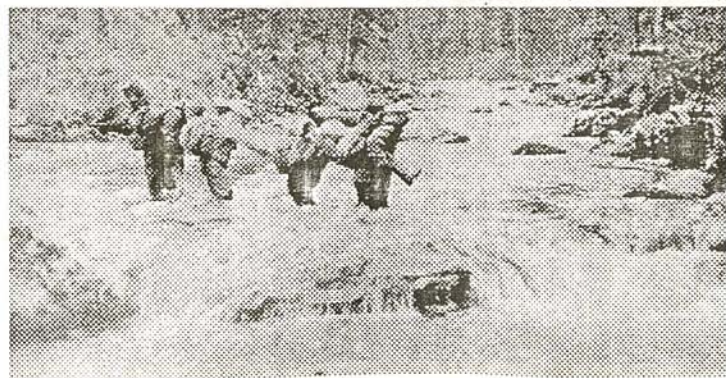
Переход горной реки