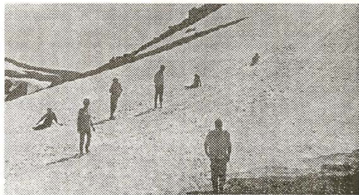
Вечные снега Каракольских озер