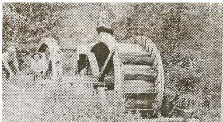
Остатки водяных колес в верховьях Каракокши

Краеведческая работа Эльзаса Павловича - это еще и встречи со старожилами, организация краеведческих кружков, походы по окрестностям Бийска и в предгорьях Алтая. О них расскажем в фотографии из архива Э. П. Шмойлова.