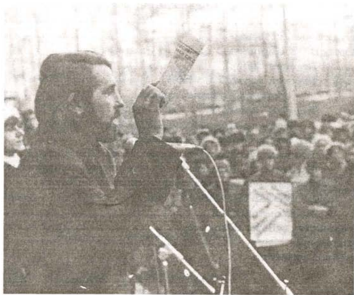
Выступление на экологическом митинге в г. Бийске (7 апреля 1989 г.)