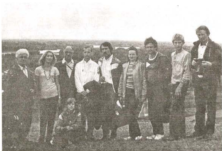
На Шукшинских чтениях 1991 года с гостями из Новосибирского академгородка.