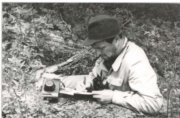
1968 г. Первая заповедь зоолога-полевика: всё, что увидел, немедленно записать в дневник.