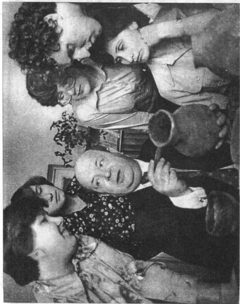
На занятии археологического кружка