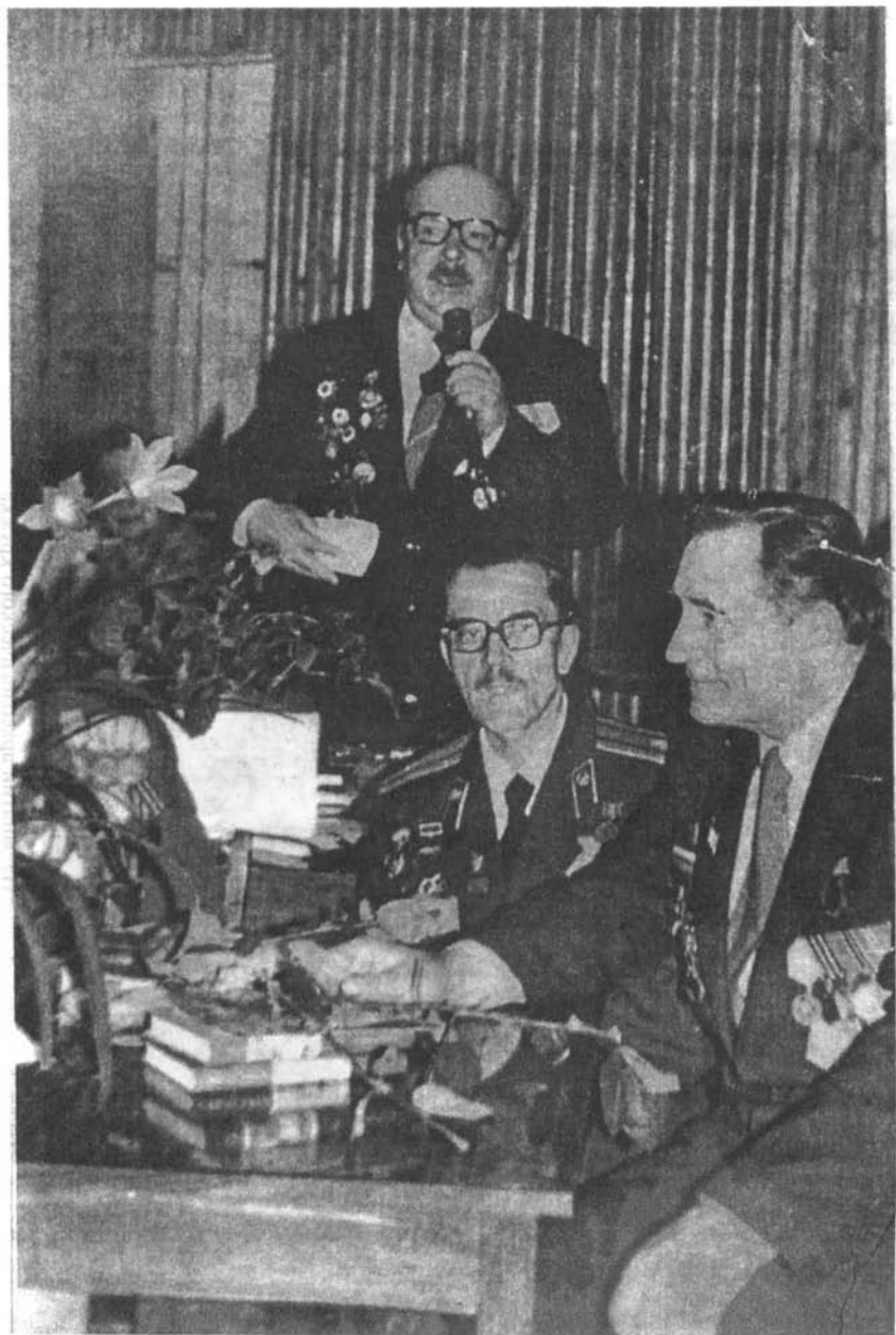
На встрече с ветеранами