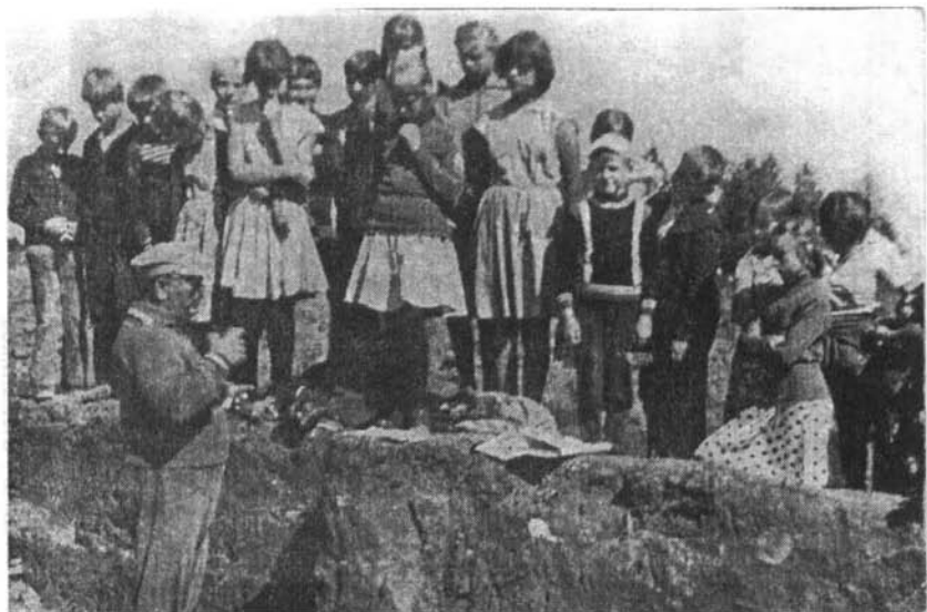
с. Рогозиха. Курганы. Школьники на на раскопе